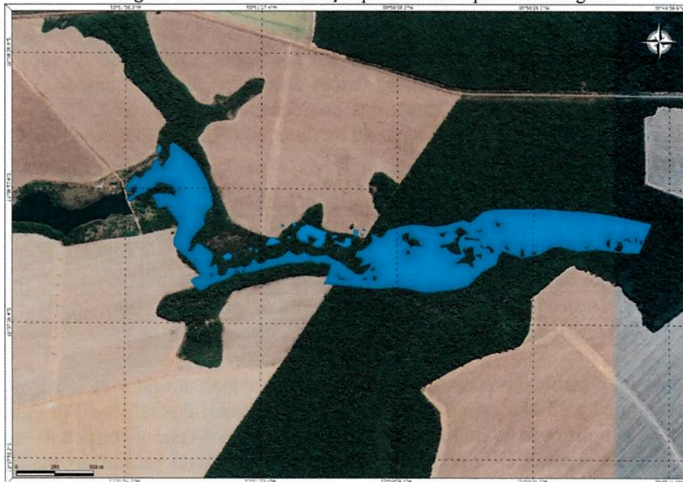
Figura 1: Mancha de inundação por eventual ruptura da barragem.